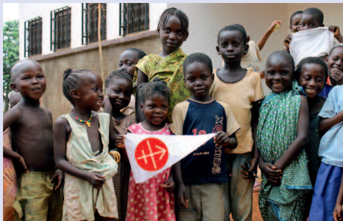
Ihre Zukunft ist auch unsere: Kinder aus der Zentralafrikanischen Republik sagen Danke.

Die steigende Anzahl der Hilfsanträge aus Afrika spiegelt auch das Wachstum der Kirche auf diesem Kontinent wider, sie macht mittlerweile 34 Prozent aller Anträge aus. Besonderes Augenmerk liegt auf den Ländern in der Sahelzone, auf Nordnigeria, Kenia, Tansania und Madagaskar – Länder, in denen sich eine aggressive Form des Islam ausbreitet. Im Nahen Osten, der Wiege des Christentums, schlägt die Not- und Existenzhilfe stark zu Buche. Sie sichert die Präsenz der Christen in der Region. In Asien braucht die Kirche nicht nur in den Ländern Hilfe, die unter dem Kommunismus litten und leiden – China, Vietnam, Laos –, sondern vermehrt auch in jenen Ländern, in denen ein radikaler Hinduismus oder Islam die Christen in Bedrängnis und Not bringt, etwa in Indien und Pakistan und auch in Teilen der Philippinen. In Mittel- und Osteuropa verlagert sich die Hilfe von Bauprojekten auf Aus- und Fortbildung. In den Fokus rücken in diesem Teil der Welt vor allem die Länder auf dem Balkan, wo ebenfalls radikale Formen des Islam den Christen das Leben schwer machen. Unsere Solidarität hilft den Christen auch dort, im Glauben standhaft zu bleiben.