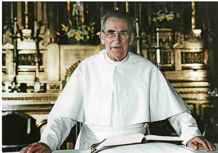
Pater Werenfried van Straaten 1992 In Spanien.