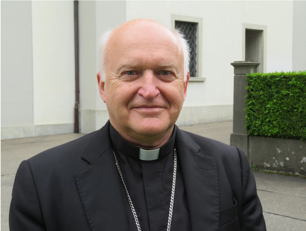
Ladislav Nemet ist seit 2008 Bischof von Zrenjanin.

Referenz: 80965057 Ausschnitt Seite: 3/3