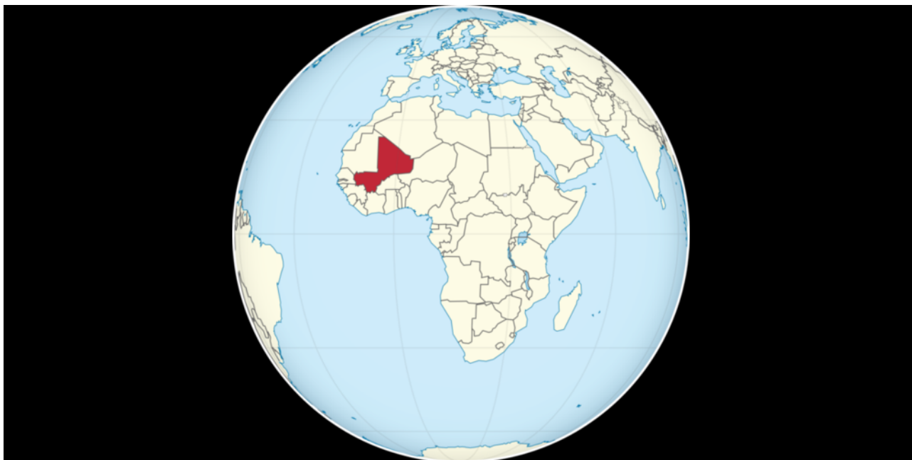
Mali, der seit vielen Jahren zwischen verschiedenen Religions- und Interessengruppen zerriebene grossflächige Wüstenstaat