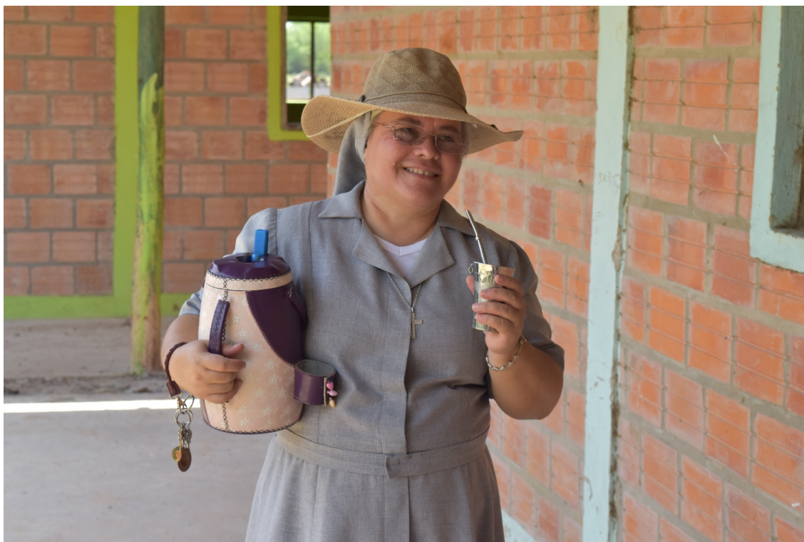
Eine Ordensschwester mit dem landesüblichen Tereré, Chaco, Paraguay