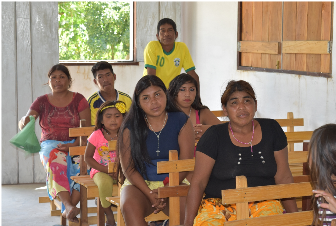
Gottesdienstbesucher, Chaco, Paraguay