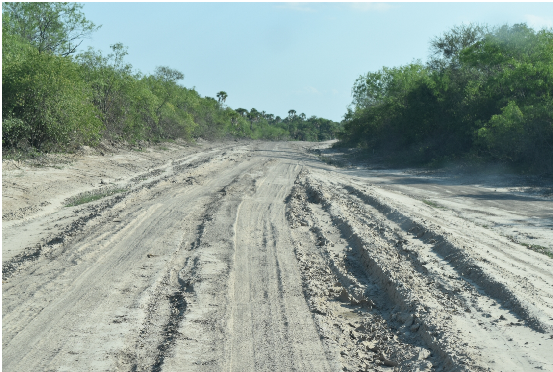
Eine typische Strasse im Chaco

Referenz: 84444760 Ausschnitt Seite: 4/4